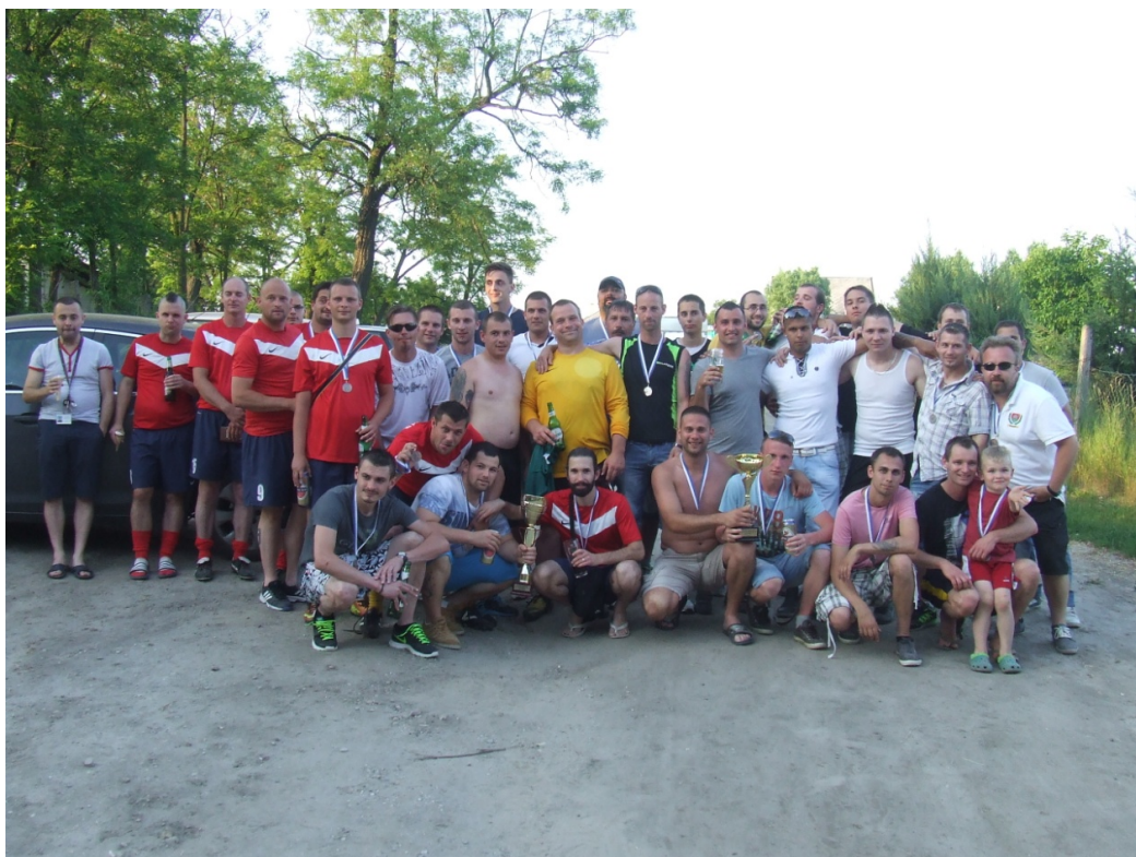
Bronz és ezüst érem ünneplése, együtt a két keret