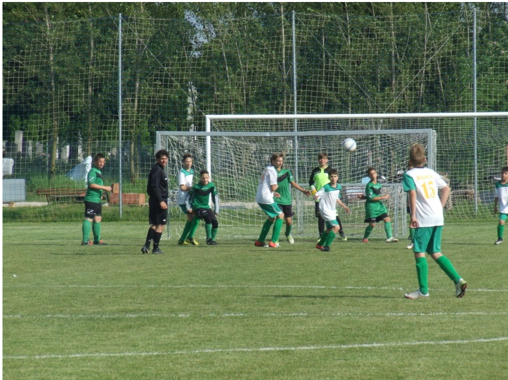
Az utánpótlás /U14/