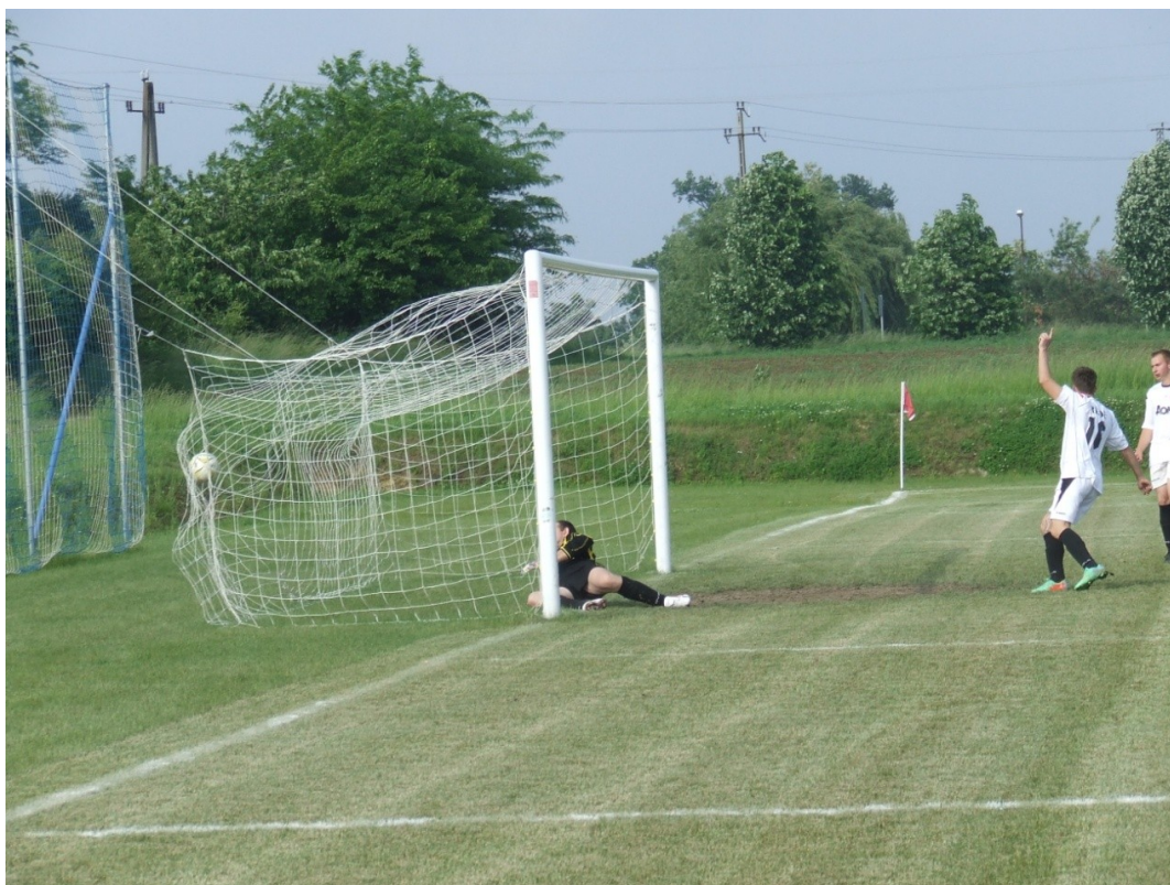
Zörög a háló az új pályán.