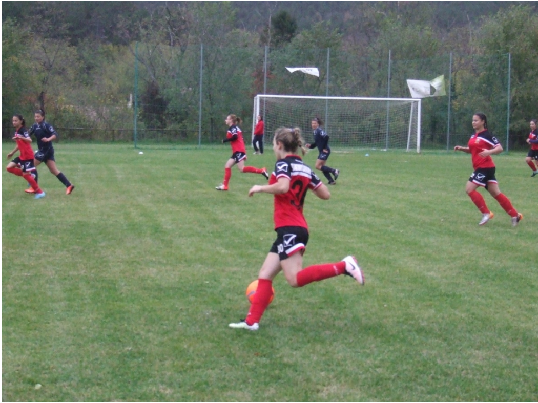
Női csapat Annavölgyön