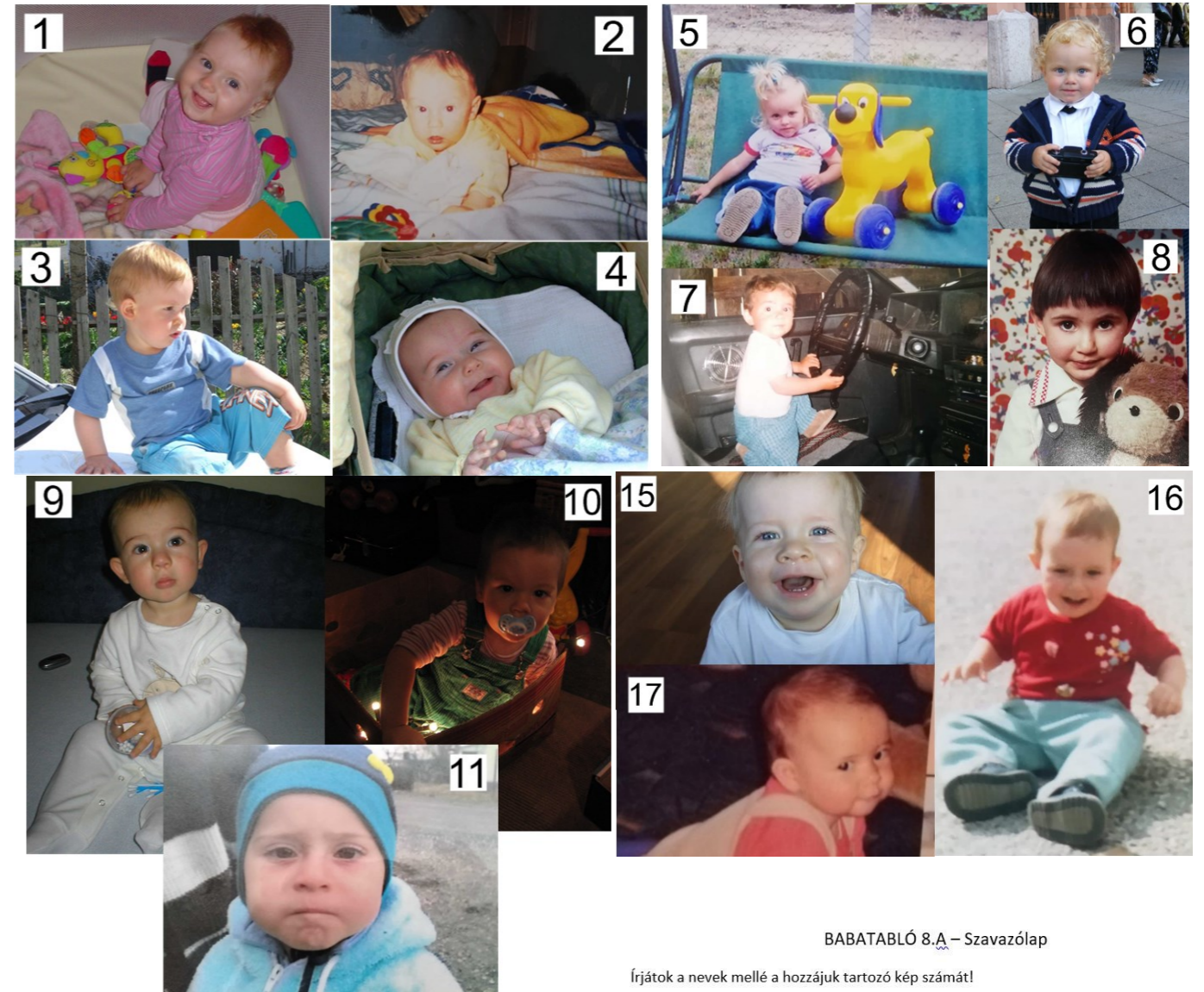
BABATABLÓ 8.A – Szavazólap

A sorozat első részében négy tanulót láttok a 8.A osztályból.