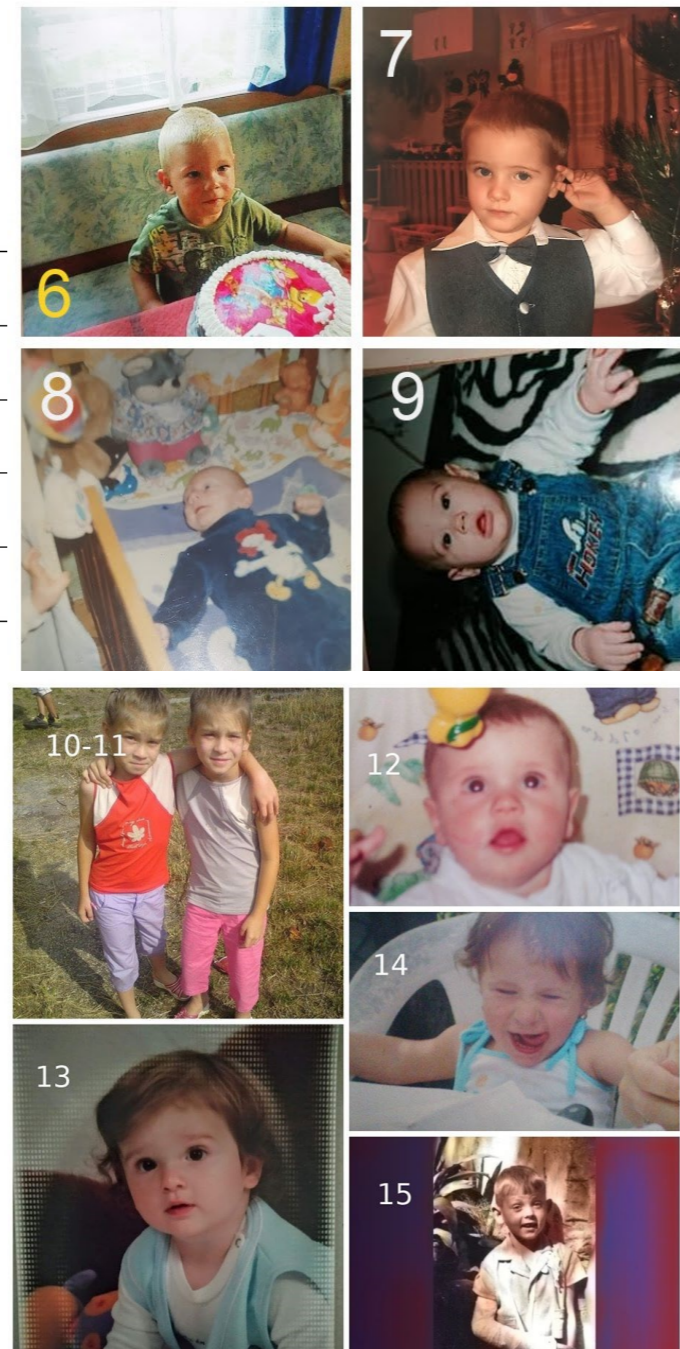
8. B osztály Bébi Tabló

A sorozat első részében négy tanulót láttok a 8. B osztályból.