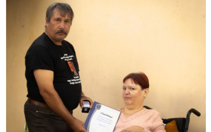
Bakonysárkány Község Polgárőr Egyesület